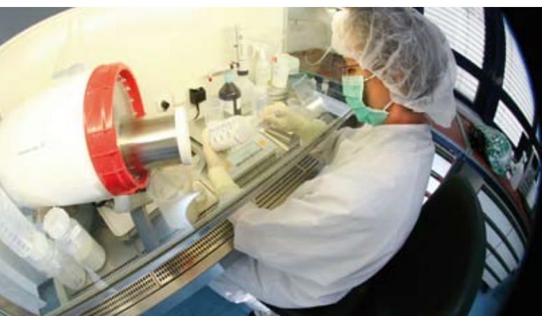
Gestaltung: formbund

Technologiezentrum Warnemünde e.V. Friedrich-Barnewitz-Straße 5 18119 Rostock-Warnemünde Telefon: 0381. 51 96 - 101 Fax: 0381. 51 96 - 2 66 E-Mail: petra.ludwig@tzw-info.de www.tzw-info.de Geschäftsführerin: Petra Ludwig