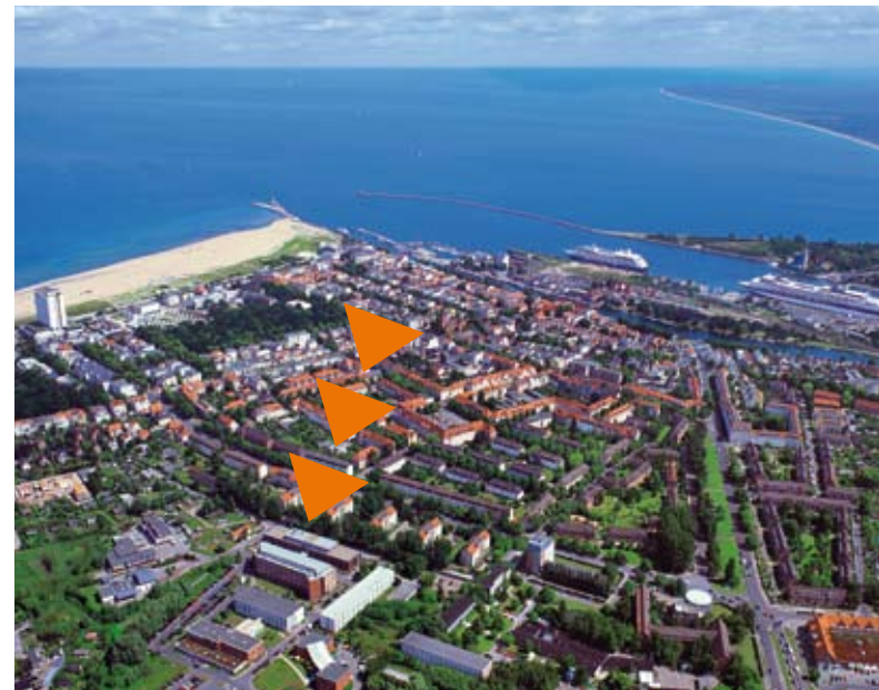
Das Technologiezentrum Warnemünde im Technologiepark

Der Standort bietet eine hohe Lebensqualität und ist eingebettet in eine reizvolle Küstenlandschaft. Die Warnemünder Altstadt am Alten Strom und der unübertroffen breite, weiße Sandstrand bieten Lebendigkeit und Naherholung gleichermaßen.